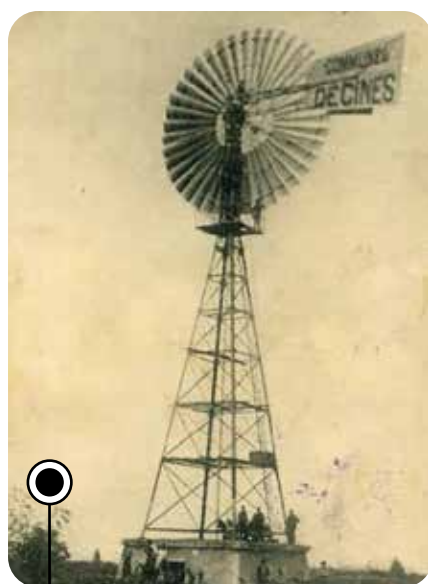
Installée en 1912, l'éolienne assurait la distribution de l'eau aux Décinois