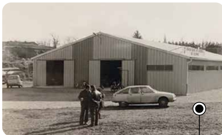
Depuis 1970, les berges du Canal de Jonage accueillent les activités de l'Aviron Décinois.