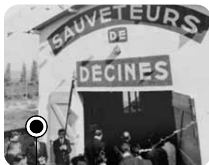
Avant l'Aviron Décinois, les Sauveteurs Volontaires de Décines disposaient d'un local sur le site.

Suite à la reprise de la compétence Secours par la Communauté urbaine à la fin des années 1960, les Sauveteurs Volontaires de Décines doivent se reconverter. C'est ainsi que se crée l'Aviron Décinois. Aidé par le rameur international Jean-Robert Genest, le nouveau club remporte de nombreuses compétitions dès ses premières années d'existence. Pour protéger les embarcations et permettre aux adhérents de s'entraîner dans les meilleures conditions, un hangar de 500 m 2 est construit en 1977, qui sera agrandi en 1990 avec la création d'une section Loisirs. Ce local sera utilisé par les membres de l'Aviron Décinois jusqu'en 2024, date du début des travaux du Pôle Sportif et de Loisirs. Ce nouveau bâtiment accueillera, en plus du club d'aviron, une maison des associations et une Maison du Vélo. ■