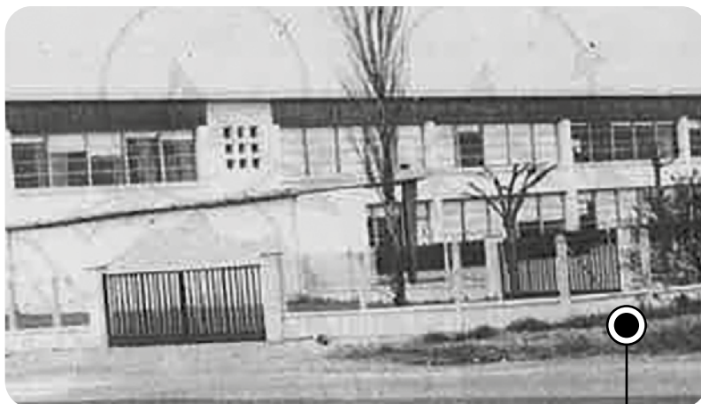
L'école Beauregard accueille les petits décinois depuis 1961.