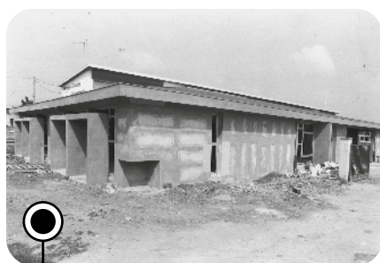
Pour suivre l'arrivée de nombreux nouveaux élèves, une école maternelle est construite en 1979.