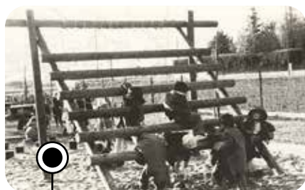
En 1985, les élèves de l'école maternelle peuvent profiter d'une nouvelle cour de récréation.