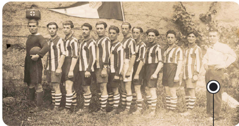
L'équipe de l'UGA Décines, ici en 1929, connaît des débuts laborieux