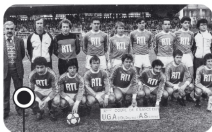
Au cours de son histoire, l'UGA Décines-Lyon connaît des moments de gloire, et atteint même les 32 e de finale de la Coupe de France en 1984.