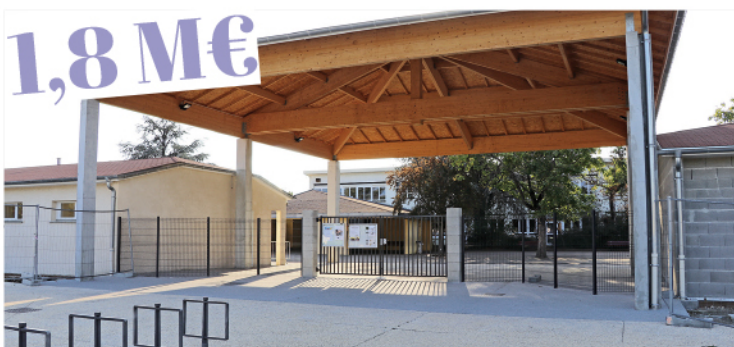
Rénovation du patrimoine (isolation et étanchéité, avec un focus sur les écoles)