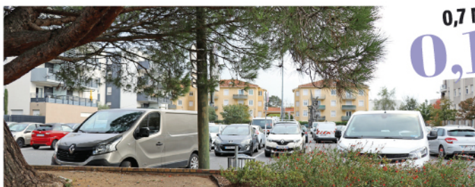
Reconstruction du Centre social Françoise Dolto et de la Mairie Annexe