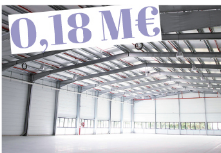
Construction d'un hangar