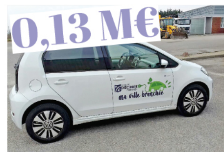
Rénovation de la flotte automobile