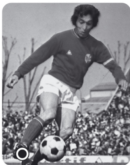
Grande figure décinoise, l'international Jean Djorkaeff donne au club une nouvelle impulsion dans les années 1970.