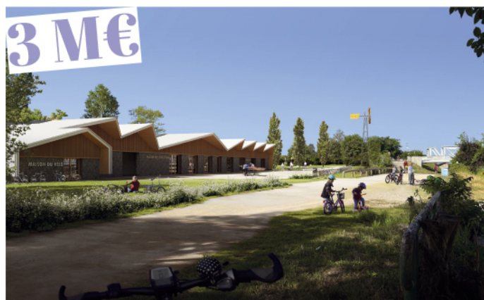
Construction du pôle sportif et de loisirs