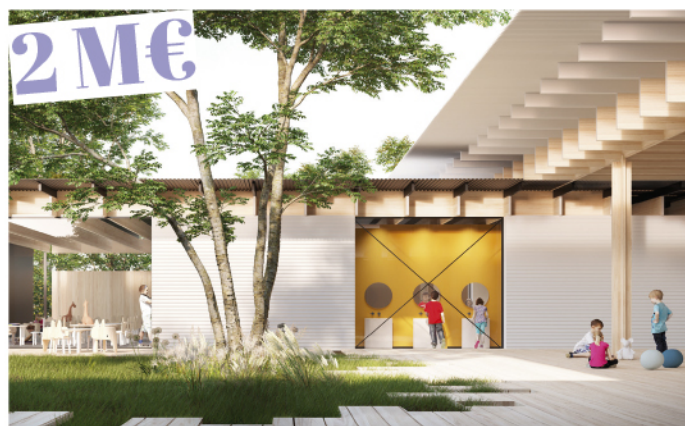
Reconstruction du centre aéré des Marais