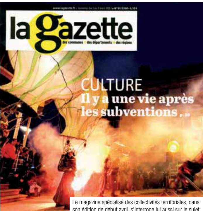
Le magazine spécialisé des collectivités territoriales, dans son édition de début avril, s'interroge lui aussi sur le sujet.