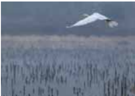
La Nature «Photographies» de PASCAL FRONTI

«Plongé dans la photographie depuis ma tendre enfance grâce à la passion de mon père, j'ai trouvé en elle une façon de m'évader...»