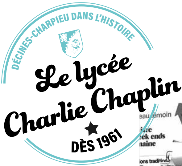
Manifestation pour la construction d'un lycée à Décines-Charpieu en 1973 Archives de la Ville de Décines-Charpieu - 1973