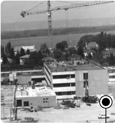
La construction du lycée démarre enfin après des années d'action Archives de la Ville de Décines-Charpieu - 1978