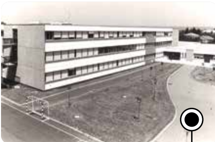
Le lycée ouvre ses portes à 376 élèves de l'Est lyonnais 1979

La construction d'un lycée à Décines-Charpieu est inscrite sur la carte scolaire nationale en juin 1961. Les terrains sont rapidement réservés par la mairie, puis validés par le Ministère de l'Éducation nationale. Cependant, le financement de l'établissement n'étant pas retenu dans les plans économiques de l'État, la construction est repoussée plusieurs fois au cours des années suivantes. Malgré de nombreuses actions menées par les parents, élèves et élus de Décines-Charpieu et des communes alentours, ainsi que l'appui de la Communauté urbaine de Lyon, créée en 1969 et compétente en matière de lycées, les pouvoirs publics ne cèdent pas. La situation s'aggrave pourtant d'année en année : la forte évolution démographique et le manque de lycées dans l'Est lyonnais impliquent que de plus en plus de jeunes doivent se rendre à Villeurbanne et Lyon pour étudier, bravant des conditions difficiles de transports et perdant un temps précieux. Ils obtiennent gain de cause auprès du préfet en 1976, avec l'inscription du lycée au programme de l'année 1977. Le chantier démarre finalement au début de l'année 1978 rue Francisco Ferrer.