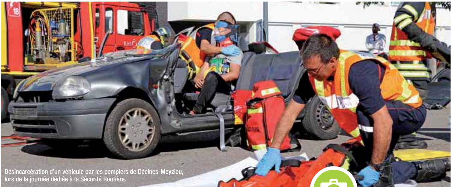
Désincarcération d'un véhicule par les pompiers de Décines-Meyzieu, lors de la journée dédiée à la Sécurité Routière.