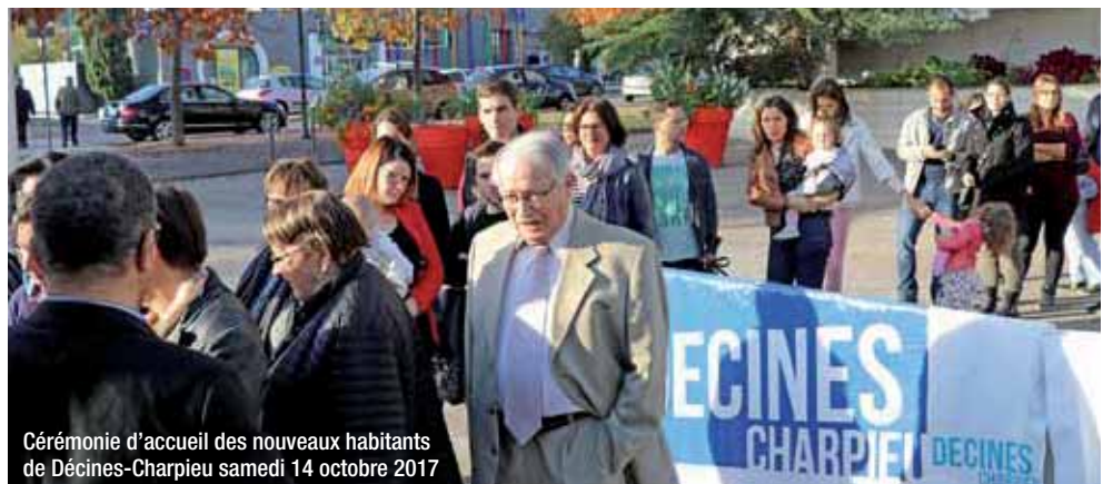
Cérémonie d'accueil des nouveaux habitants de Décines-Charpieu samedi 14 octobre 2017