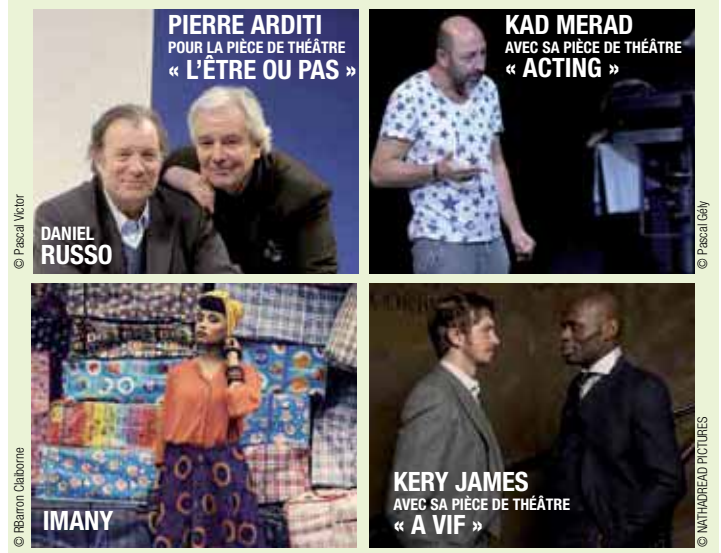
PIERRE ARDITI POUR LA PIÈCE DE THÉÂTRE « L'ÊTRE OU PAS » DANIEL RUSSO