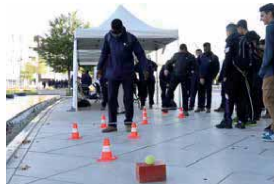
VOUS ÉTIEZ 600 11 OCTOBRE - 24H DE LA PRÉVENTION ROUTIÈRE