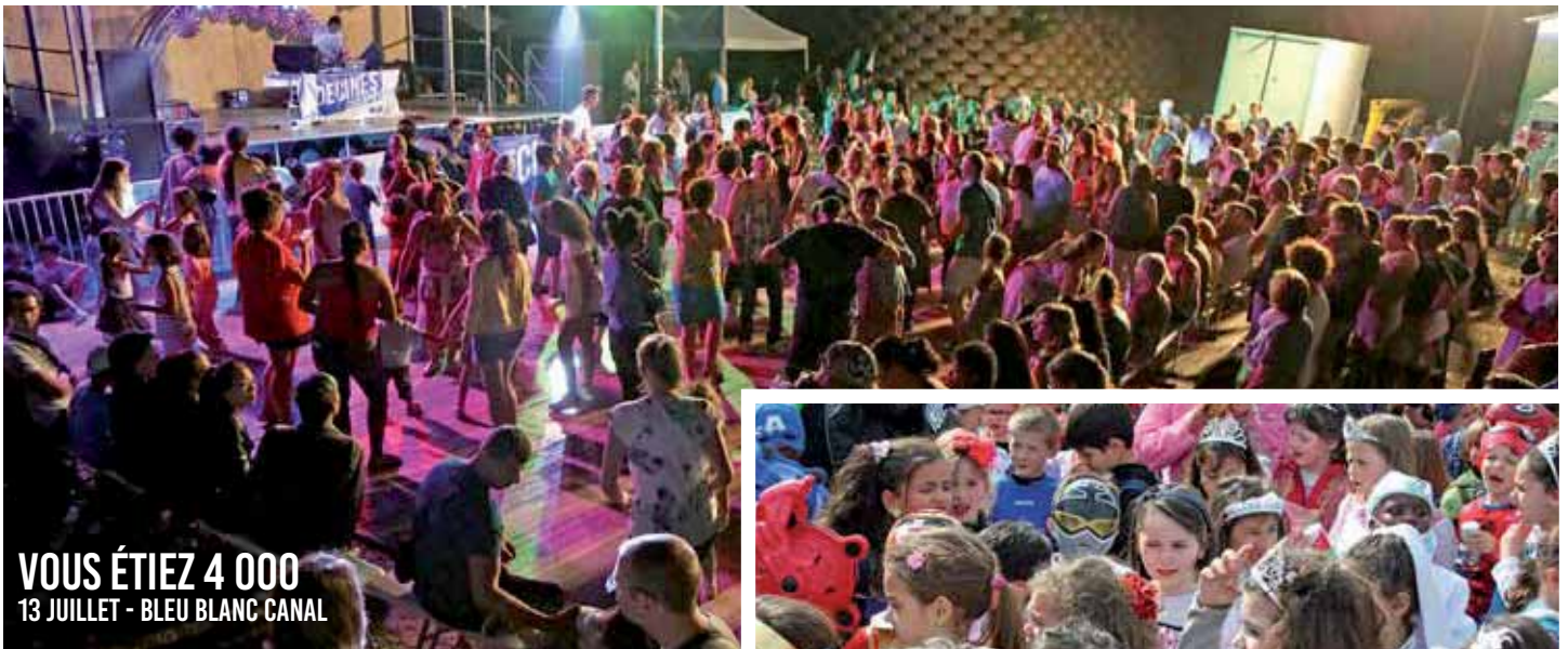
VOUS ÉTIEZ 4 000 13 JUILLET - BLEU BLANC CANAL