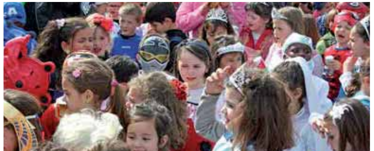
VOUS ÉTIEZ 2 000 18 MARS - CARNAVAL