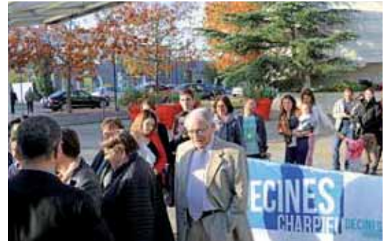
VOUS ÉTIEZ 100 14 OCTOBRE - NOUVEAUX ARRIVANTS