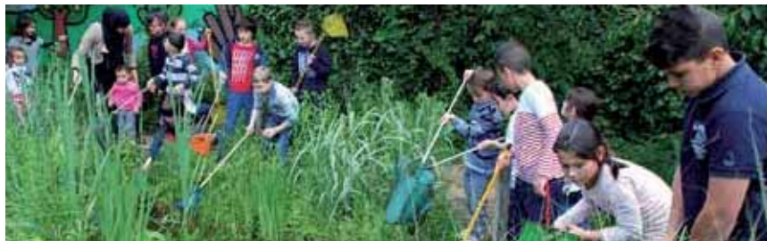
VOUS ÉTIEZ 1 200 20 MAI - TOUS AU JARDIN