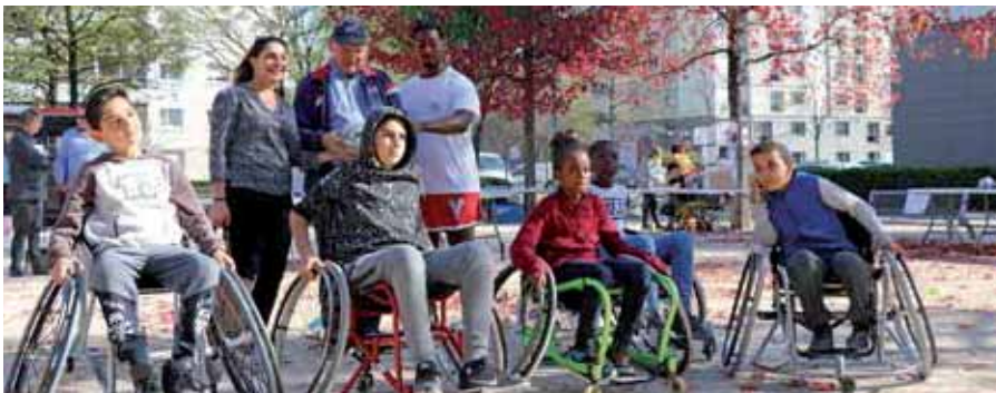
VOUS ÉTIEZ 1 550 OCTOBRE - MOIS DE LA SANTÉ