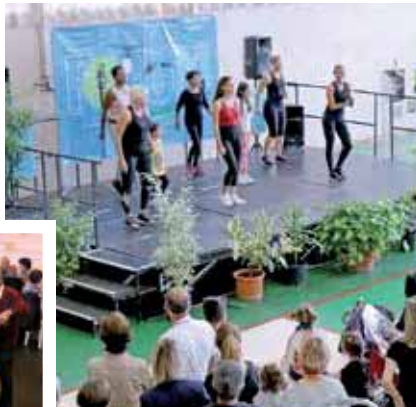
VOUS ÉTIEZ 620 7 OCTOBRE - REPAS DES SENIORS