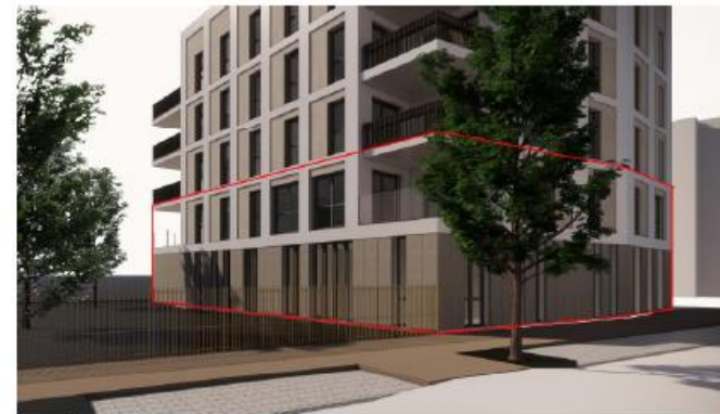
vue depuis le parc