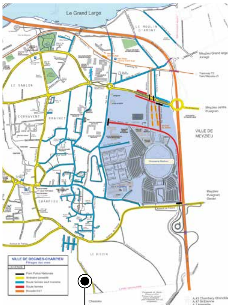
Le plan de la résidentialisation, mise en place les soirs d'événement au Groupama Stadium.